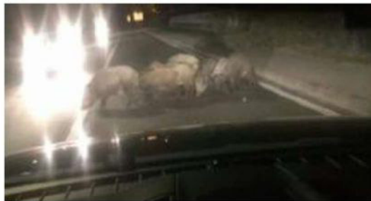
I cinghiali attraversano la strada ad Arbizzano

Sempre più verso valle: che la presenza dei cinghiali in Valpolicella fosse rilevante è cosa nota, ma colpisce l'immagine scattata da un automobilista che ne ha immortalati cinque mentre attraversano la provinciale alle porte di Arbizzano. In Lessinia, invece, i lupi restano nel mirino di residenti e allevatori: Il branco ne conta dodici ma potrebbero essere quindici. ● PAG 25-27