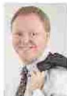
Politico Sergio Berlato è consigliere regionale di Fratelli d'Italia in Veneto

«Nessuna invasione: si prevede solo la possibilità per la Giunta regionale, d'intesa con l'ente Parco e i Comuni, di adottare piani di contenimento della fauna selvatica: il prelievo straordinario sarebbe autorizzato per i soli residenti nella zona afflitta da quella che è ormai una piaga vera e propria. Dopo dieci anni di chiacchiere, è il tempo dell'azione».