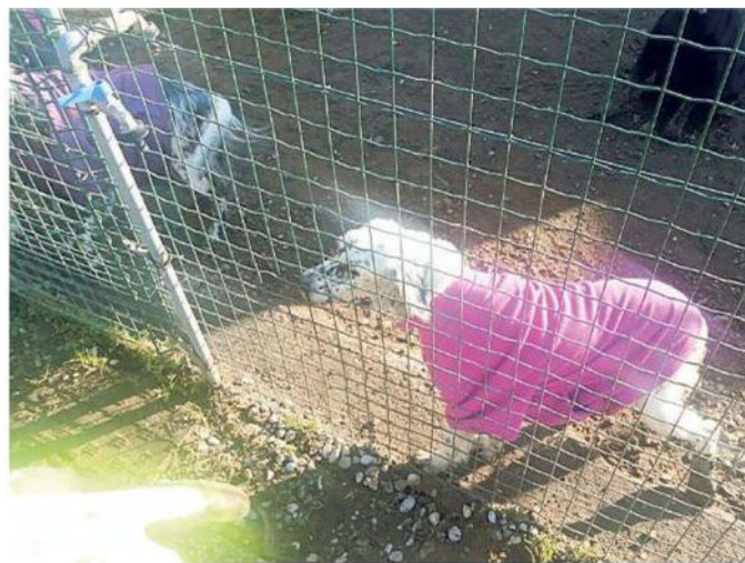
Uno dei cani portati in canile dopo essere stati tolti all'anziana