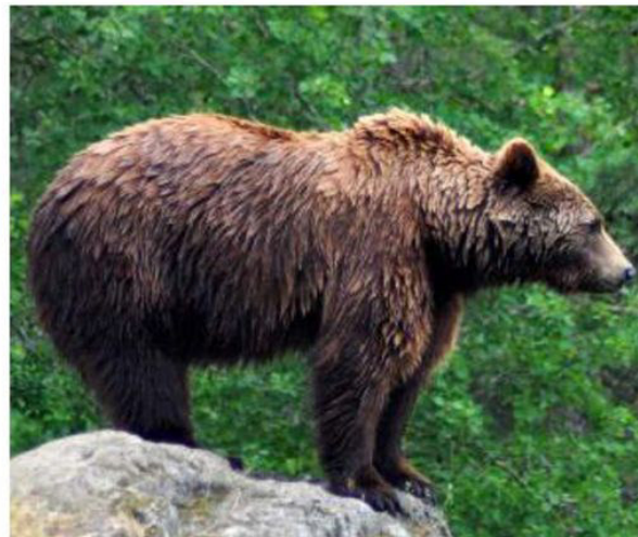
L'orso M5, battezzato con il nome "Dino"