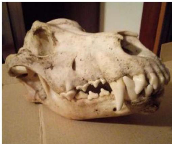
Il cranio d'orso rinvenuto dagli escursionisti a Sasso di Asiago

Non è escluso che si tratti di un mammifero "di passaggio" morto in Altopiano per cause naturali