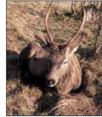
LO SPLENDO ESEMPLARE