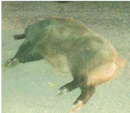
Un cinghiale morto in mezzo alla strada investito da un'auto di passaggio